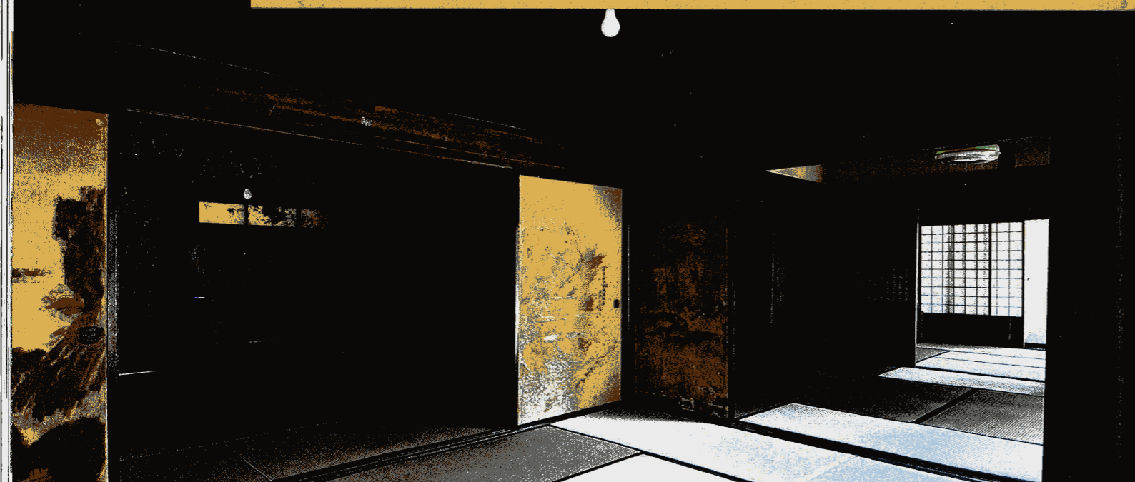
調査の後、最新の技術で修復した書院。奥座敷の黄金色の輝きと前座敷のラピスラズリーの深みが対比し、商家とは思えない華麗な意匠が異彩を放っている

村松健齋(1826-1885)は、文政9年(1826)に村内の儒医・3代勝格弥(本堂)の次男として生まれ、兄・4代勝格弥(開堂)とともに、外科に長じ広範な活躍を見せる。後に村松家に入婿、「清吟書屋」を実質的にデザインし商家、医家を継いで活躍、長らく「清吟書屋主人」と呼ばれた。健齋が使用したと思われる家紋入りの立派な「葉種箱」が今なお残されている。明治11年(1878)の県令・藤村紫郎宛「桃園より明穂事務所移転促進方願い」には、村惣代として勝格弥、村松健齋の署名があり、両家の村内での地位が窺わ