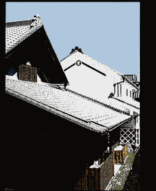
人がつくる家家がつくるドラマ Vol.15

稲作の乏しさは山国・甲州全体に言えることであったが、山に閉ざされながらも当地が街道筋に立地し、商業の発達とともに遠地と頻りに交流する流動性を持ち合わせていた